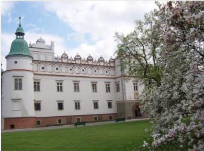
Zamek w Baranowie Sandomierski