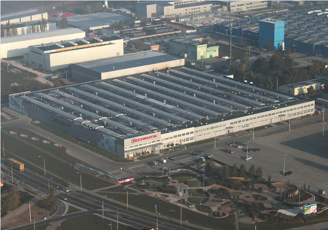
Techmatik Sp. z o.o. – Radom