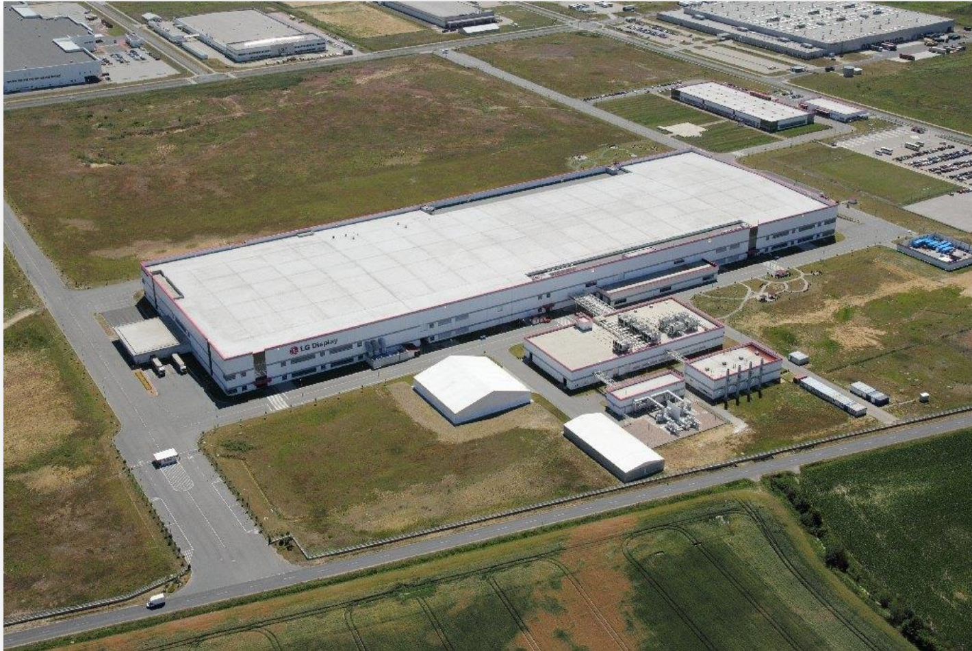
LG Display Sp. z o.o. – Wrocław