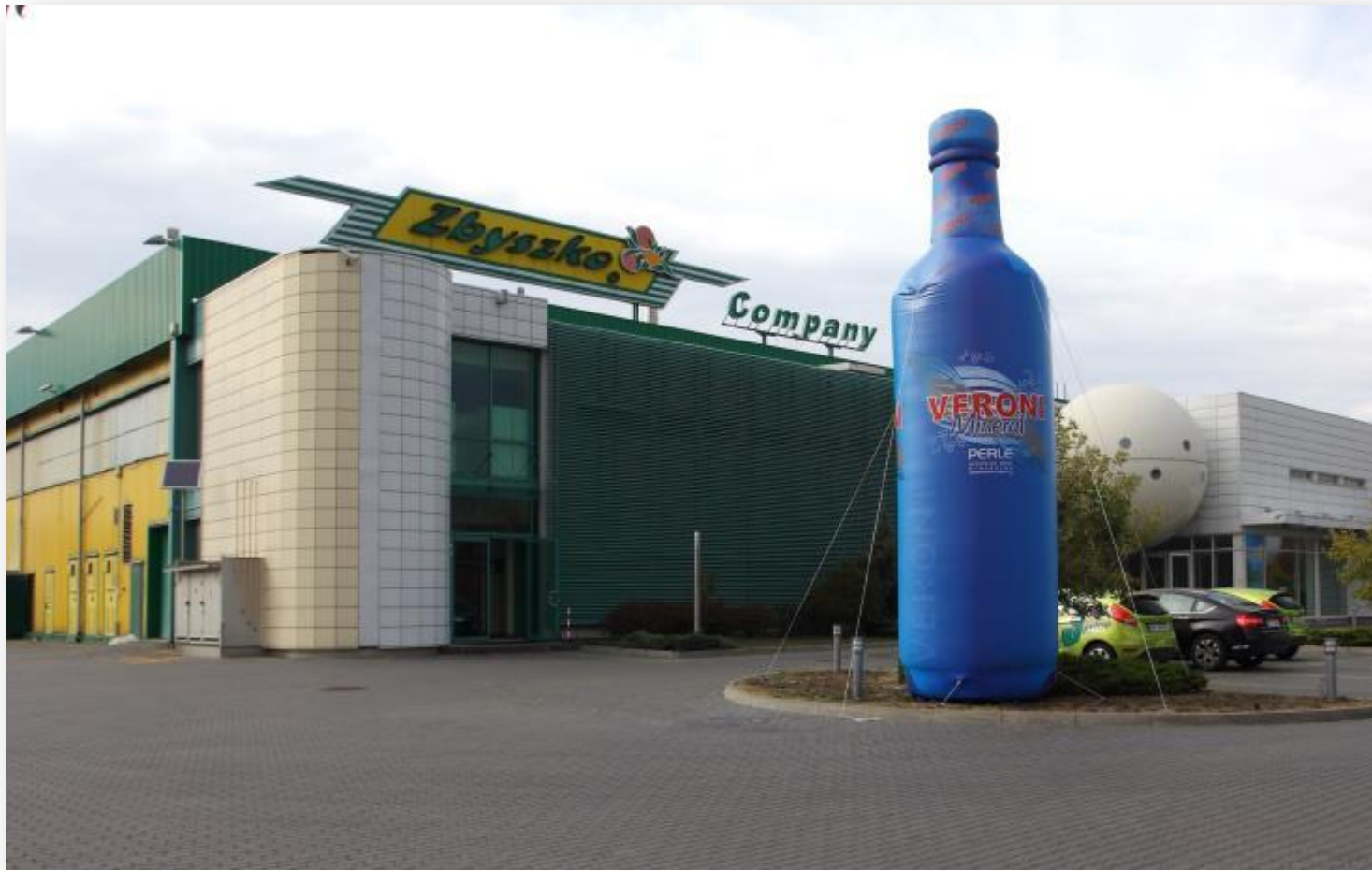
Zbyszko Company Sp. z o.o. – Radom