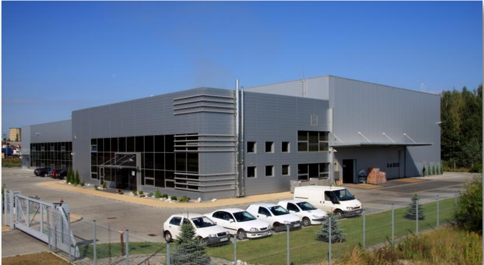
Tryumf Sp. z o.o. – Stalowa Wola