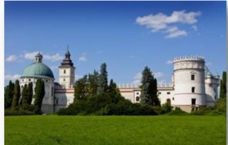
Zamek w Krasiczynie