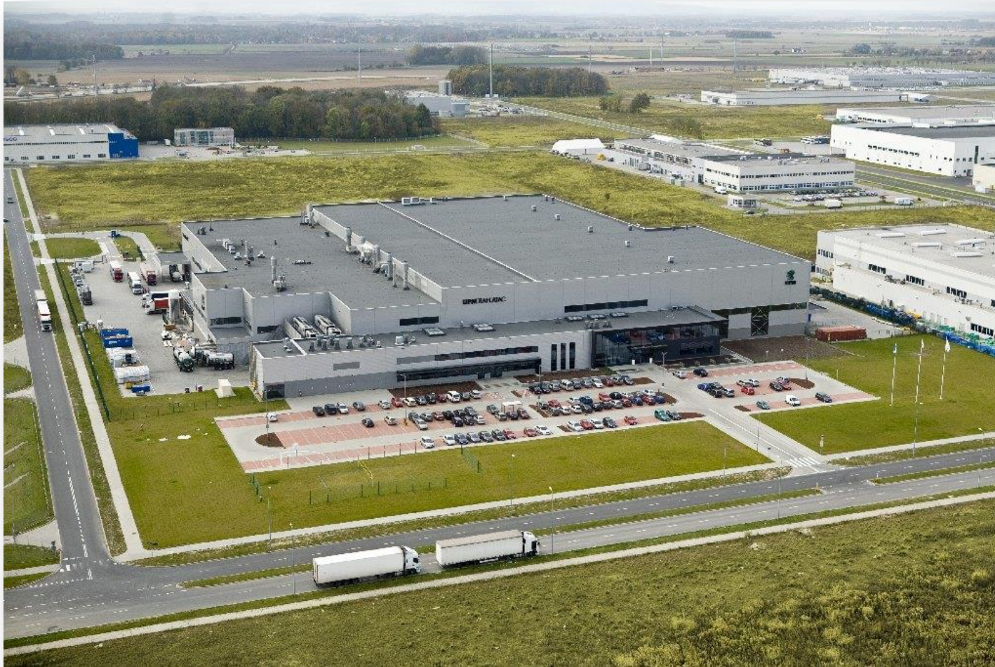
UPM Raflatac Sp. z o.o. – Wrocław