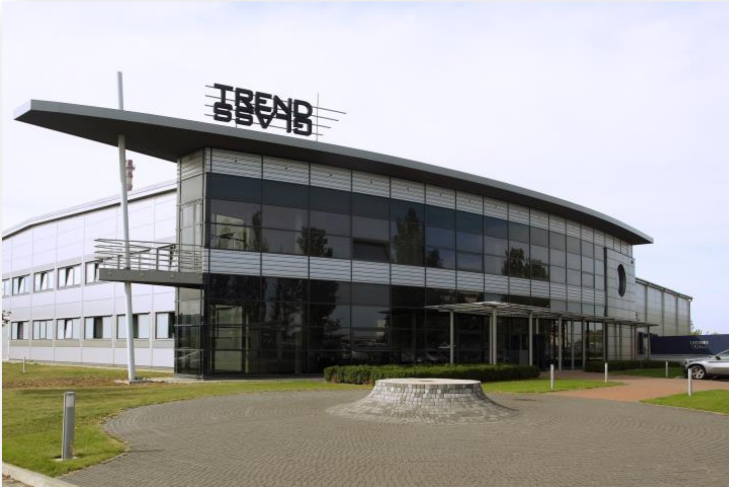
Trend Glass Sp. z o.o. – Radom