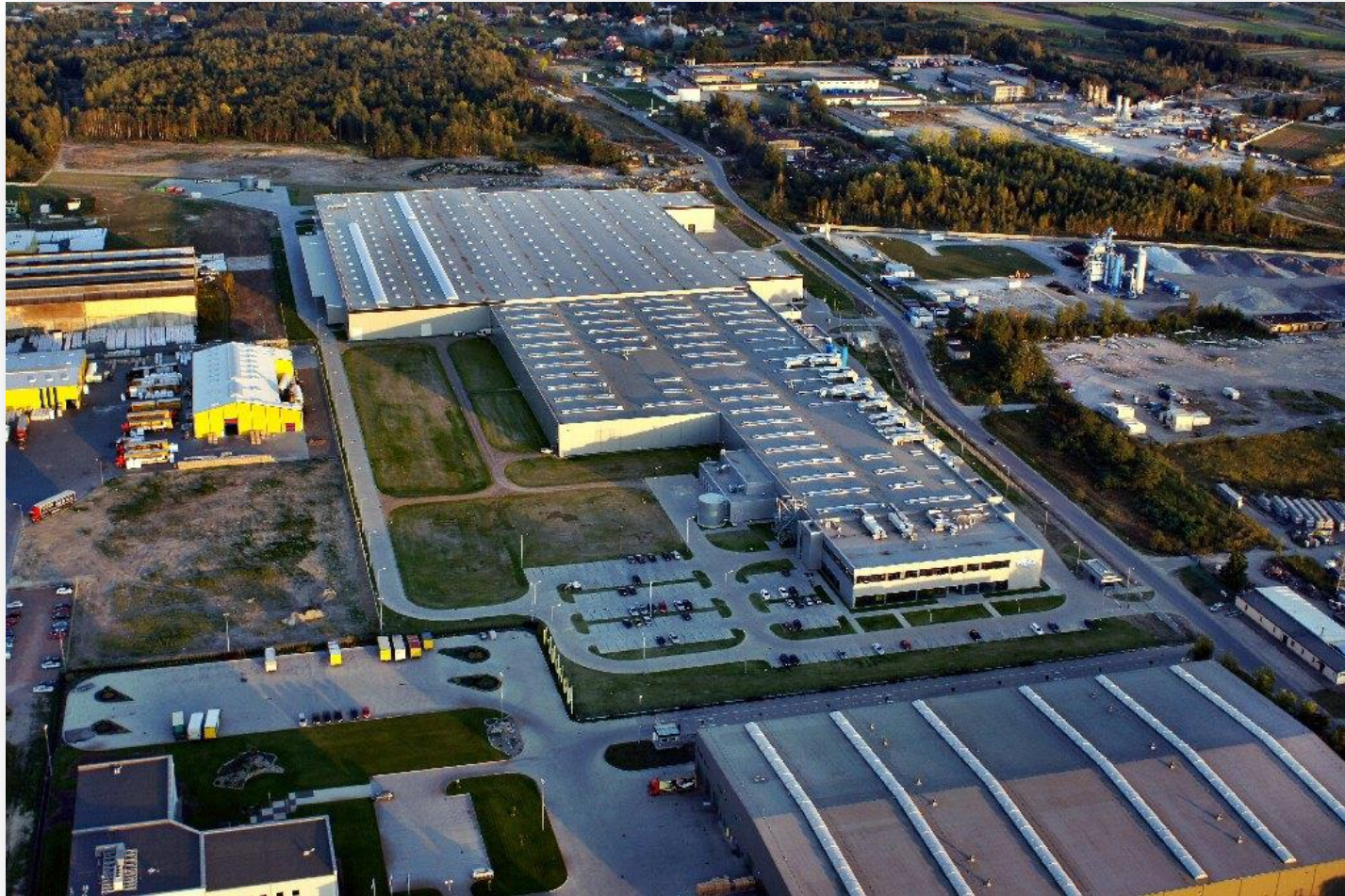
Pilkington Automotive Poland Sp. z o.o. - Tarnobrzeg